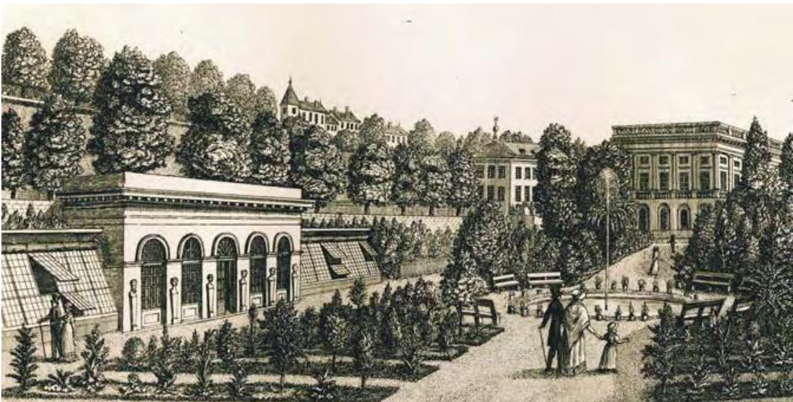
Vue du Jardin des Plantes, 1824, Pierre Escuyer, Eau-forte, VG 998/25

Située au pied de la cité, sous la Treille, la promenade des Bastions – d’abord connue sous le nom de Belle Promenade – occupe l’emplacement compris entre les fortifications du XVIe siècle, qui soutenaient la colline, et celles du XVIIe siècle, qui s’étendaient jusqu’aux actuelles rues du Conseil-Général, de Candolle et Saint-Léger