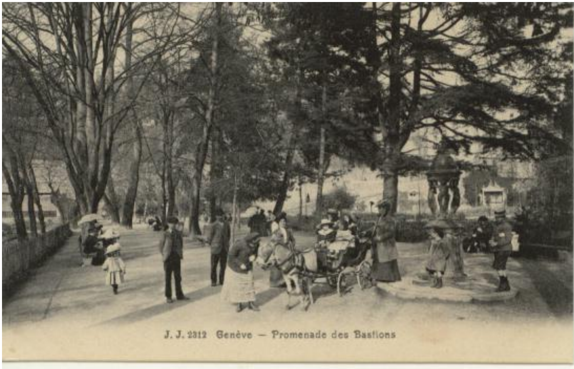
Promenade des Bastions le 13 septembre 1904

La promenade des Bastions est l'un des tout premiers jardins publics conçus dès l'origine pour le public et par les pouvoirs publics. En septembre 1726, les autorités de l'époque décident en effet d'aménager cet espace investi par les promeneurs et d'en faire une véritable promenade. D'importants travaux sont entrepris: la promenade est organisée selon un plan. Élément intéressant à relever: le petit axe est placé en regard non pas d'une maison de maître, mais de la Maison de Ville, qui domine la Treille, l'actuel Hôtel de Ville, siège du pouvoir. On agrmente la promenade, on y plante des arbres, on y installe des bancs. La surface de la promenade s'agrandit, tout d'abord en 1726, suite au comblement des fossés entre les fortifications, puis à la démolition, en 1740, du bastion de l'Oye et du déplacement de la porte Neuve en direction du Rhône. Durant la période du rattachement de Genève à la France, la promenade abrita des écuries construites à l'intention de la cavalerie des troupes de la garnison. Ces écuries furent démolies durant l'hiver 1816-1817, en pleine période de disette, et quelque 150 marronniers furent abattus; le terrain fut défriché et planté de pommes de terre.